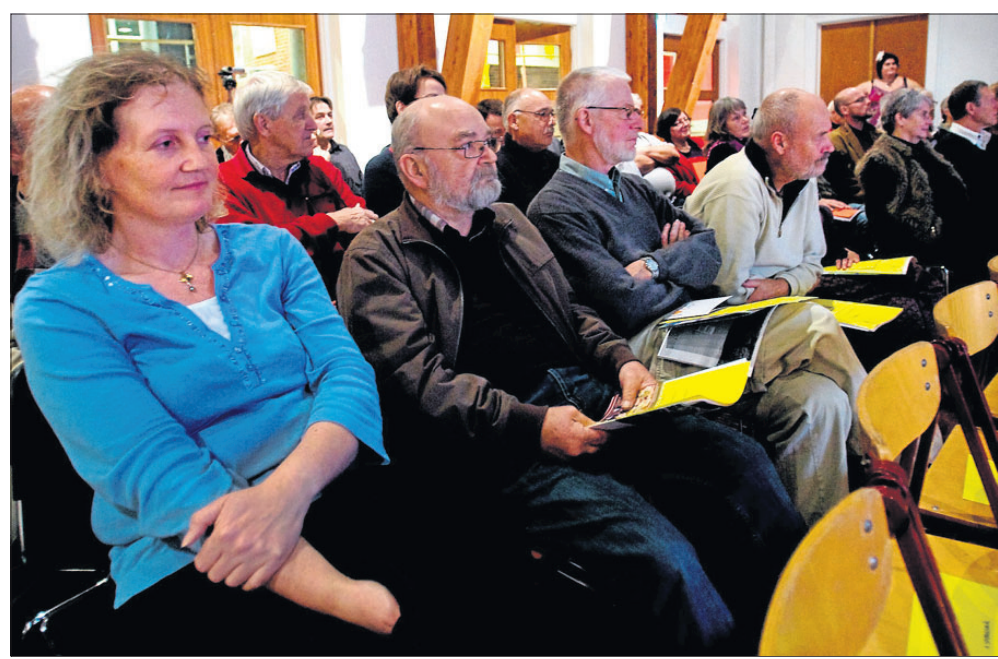
Salen i Hvalsø Kulturhus var fyldt med aktive fra foreninger og kulturlivet.

Senere mødes netværksgrupperne igen til et samlet møde - formentlig først i det nye år.